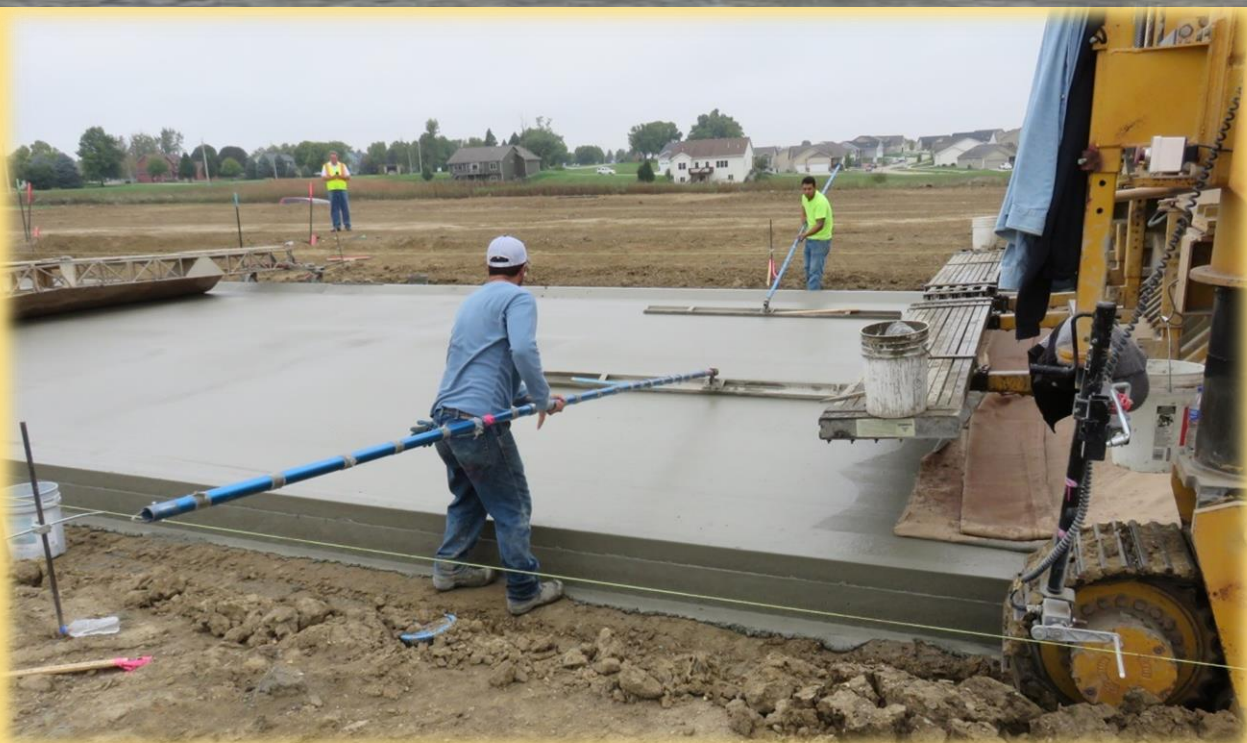
写真はフロートパンの全幅が2,440mmです。

駐車場、建物の土間、空港・道路・トンネルのコンクリート舗装など、あらゆるコンクリート施工表面を最適な状態に仕上げるフロートです。